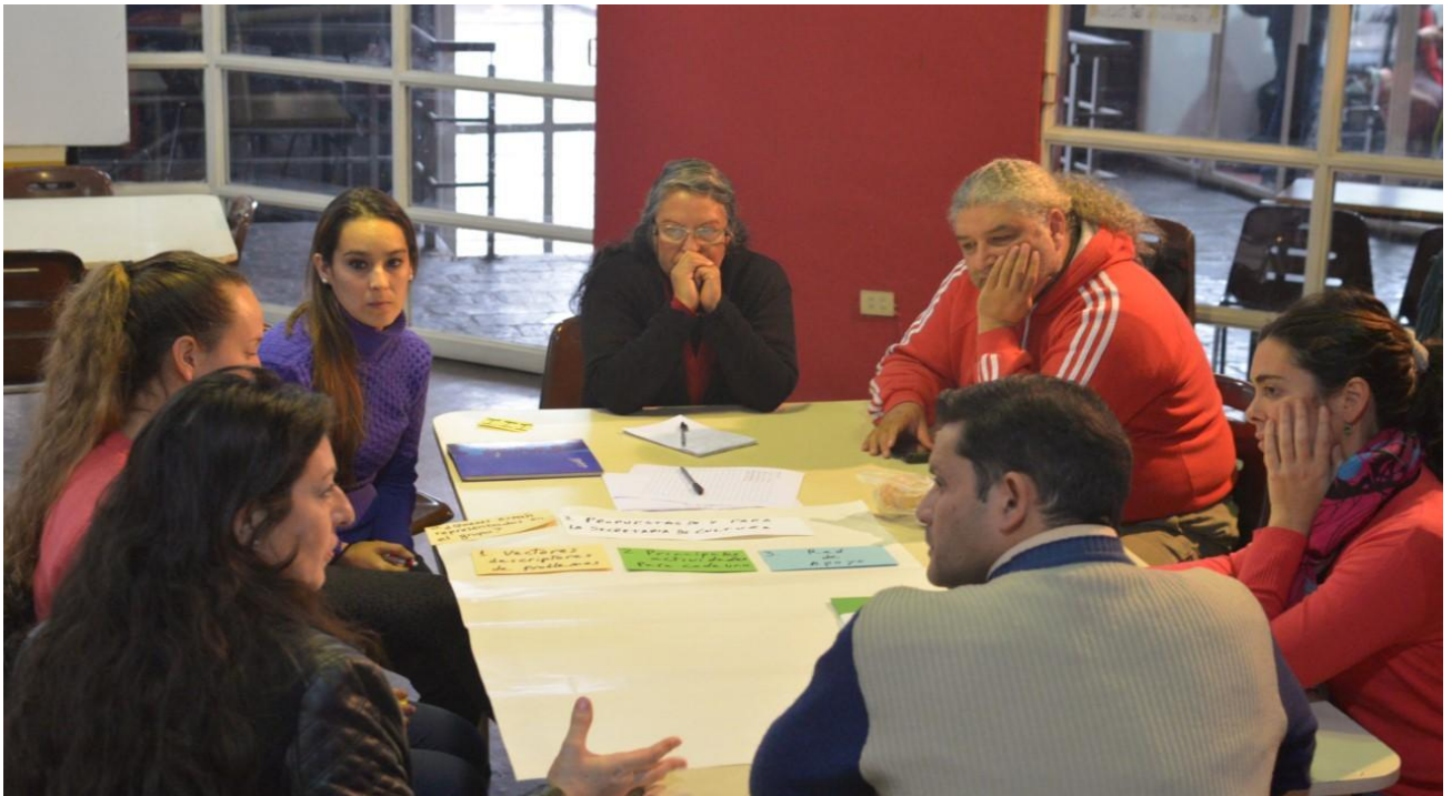
Grupo III. Eje: Propuestas de y para la Secretaría de Cultura.