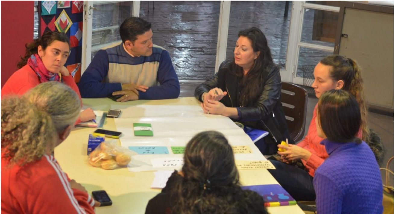
Grupo III. Eje: Propuestas de y para la Secretaría de Cultura.