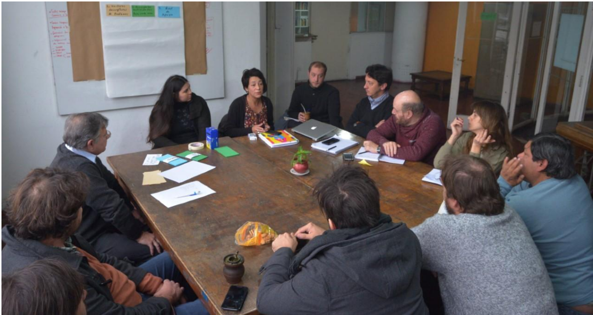
Grupo II. Eje: Identidad, generación de público y salas.