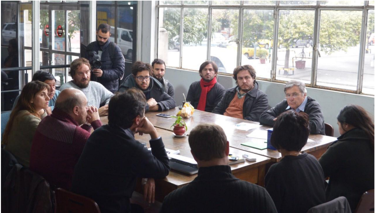
Grupo II. Eje: Identidad, generación de público y salas.