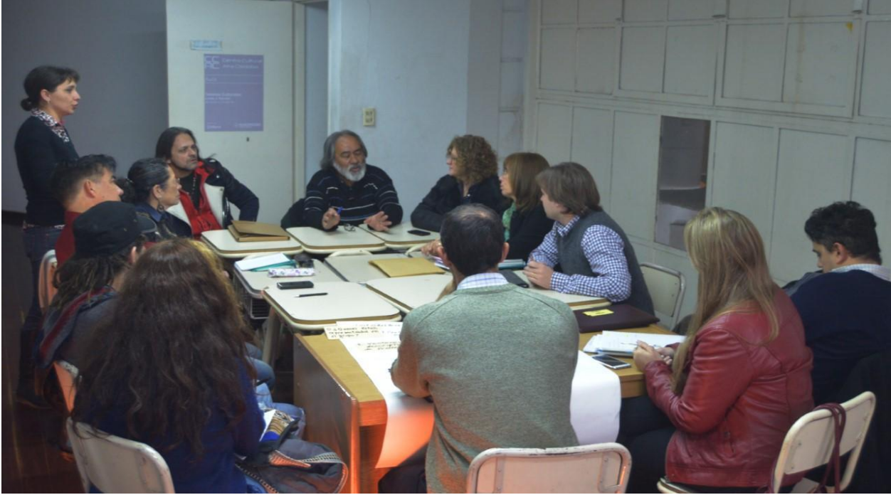
Grupo I. Eje: Propuesta Registro Municipal de Artistas y Espacios